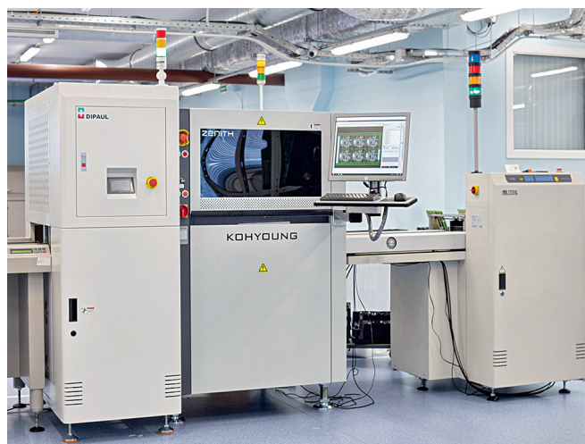
Система АОИ Koh Young Zenith

Мы сохраняем фокус на производстве высокотехнологичных изделий, насыщенных электронными компонентами, а также эксплуатирующихся в сложных условиях. Обновив установщики SMD-компонентов, мы получили возможность выпускать такие изделия крупными сериями, а следовательно, появилась необходимость проведения в реальном времени контроля качества нанесения паяльной пасты (АИП, SPI) и автоматической оптической инспекции (АОИ). Для нашего предприятия оптимальным вариантом оказались установленные в линии поверхностного монтажа современные 3D-системы контроля нанесения паяльной пасты Koh Young модели KY8030-2. Инспекция паяльной пасты в 3D, в отличие от 2D, определяя объем паяльной пасты на контактных площадках печатных плат, позволяет выявлять контактные площадки с недостаточным или избыточным количеством паяльной пасты, что предотвращает формирование некачественных