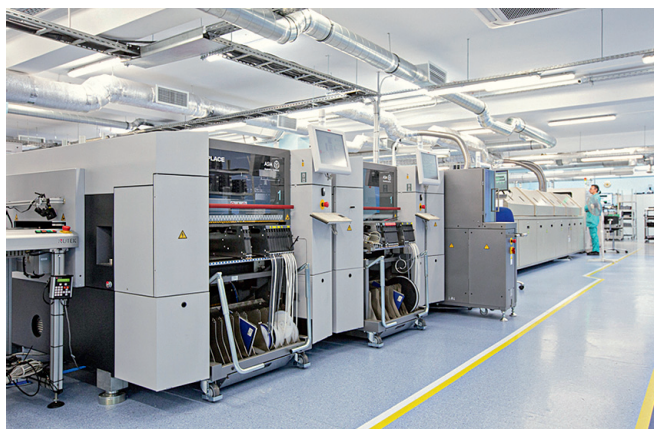
Линия поверхностного монтажа с установщиками ASM Siplace SX2

Как правило, выбор конфигурации оборудования происходит из расчета максимальной производительности на примере нескольких изделий, находящихся в производстве на текущий момент и планируемых к выпуску в ближайшем будущем. На основе анализа отобранных изделий фиксируется необходимое количество установщиков в линии, формируется их конфигурация, для каждого из них задается некоторая специализация на установку компонентов определенного типа, рассчитывается количество питателей и т. д. Таким образом, на момент покупки в линии устанавливается оборудование с определенными свойствами, позволяющими обеспечить максимальную